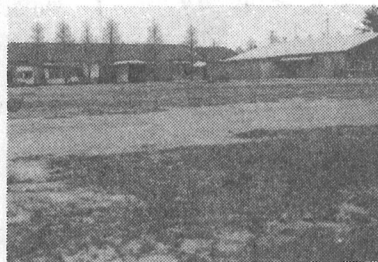
▲ 公共用地として取得した石坂善新堂跡地

議案第一号 専決処分の承認を求めることについて 地方税法の改正にともなって、昭和五十四年度の軽自動車税の税率、固定資産税の負担調整率および長期譲渡所得の税率などが次のように改正されました。 ○町民税の均等割のみを課税されている世帯の世帯員一人当りの非課税限度額が、十五万円から十六万円に引き上げられました。 ○軽自動車税の年税額が下表のように改正されました。