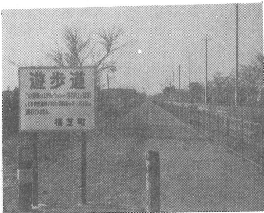
▲第1期工事で450mが完成した遊歩道

お年寄りから幼児まで、安心して歩ける歩行者専用遊歩道が、このほど横芝小下の一号線添に完成しました。 散歩に、体力づくりマラソンに、あるいはレクリエーションに、ぜひご利用ください。