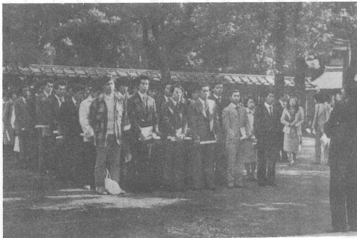
▲昨年の成人式 (明治神宮内苑にて)