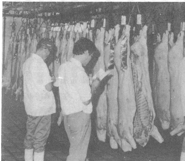
▲ 厳しい審査の中から選ばれた優良肉豚 (光町営食肉センターで)