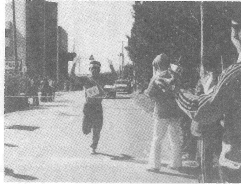
▲勝利のサインを掲げてゴールする屋形アンカー

第三回町駅伝大会は好天にめぐまれた一月二十二日、中台の桜井商店前から屋形の保養センターまで、九区間、十五・八kmを、九ブロック、八十一名の選手が参加して行なわれました。大会は終始抜きつ、抜かれつの白熱戦を展開しましたが、各区間に平均した走力を持つ第十一ブロック屋形が、二位の第一ブロック(町原、木戸台、中台、牛熊、谷台)