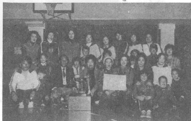
優勝した上町チームのママさんたちと応援団

小雨降る二月十二日、第一回の町婦人バレーボール大会が横芝小体育館を会場に行なわれ、上町チームが並居る強豪をおさえて優勝しました。 この大会は、日頃家庭に閉じ込められがちな町内の主婦に、手軽なスポーツ(バレーボール)を通じて健康増進と地域連帯意識の向上、明るい家庭づくりに役立てることを目的として行なわれたものです。 今大会に参加した各チームは上町、鳥喰、栗山、木戸台、長倉、東町、上堺の七チーム。試合は抽せんによりAブロック四チーム、