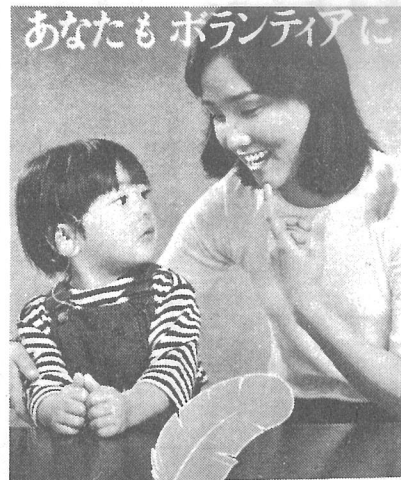
赤い羽根で福祉活動に参加しましょう