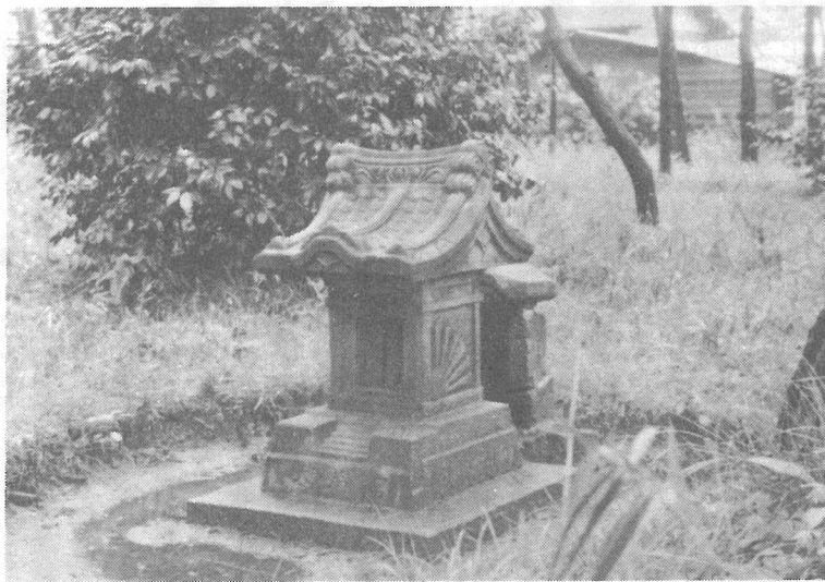
天神様の祠(上)と案内図(下)