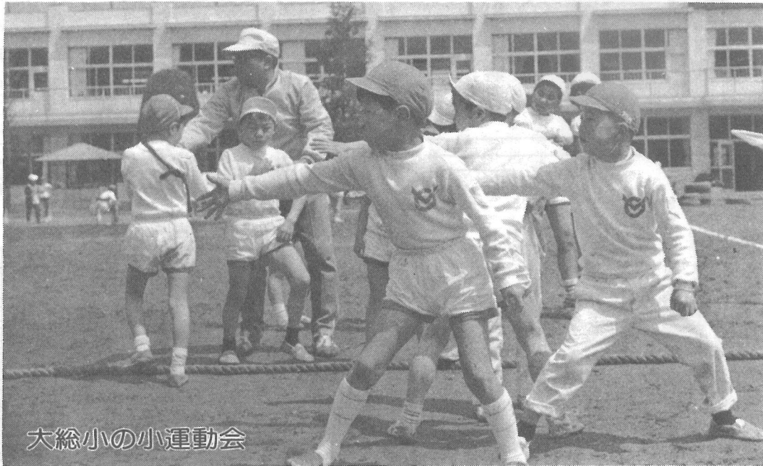
大総小の小運動会

町内の各小学で小運動会が行われました。この運動会は、新学期を迎えた子供達の向う一年間の体育目標をつかむためにということ、五月の子供の日の記念行事として各小学校で行われるようになったということです。大総小学校では五月六日に行われました。天候に恵まれた会場には、さわやかな五月の風をうけて鯉のぼりが高高々と舞い、運動場ではその鯉のぼりに負けてなるものかと子供達は競技に熱中しておりました。