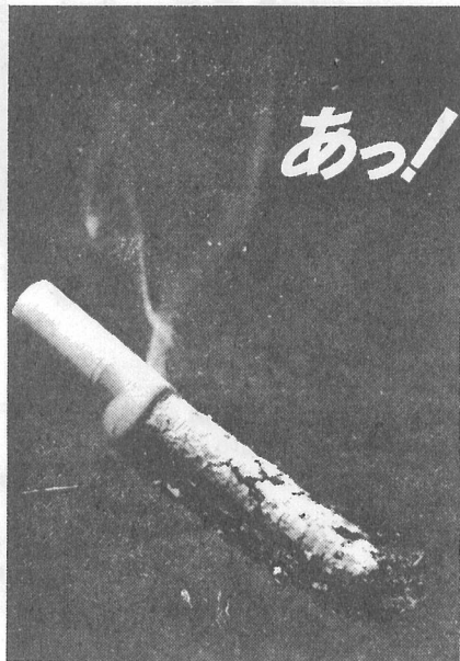
たばこは火災原因の一番 幸せを明日につなぐ火の始末!!