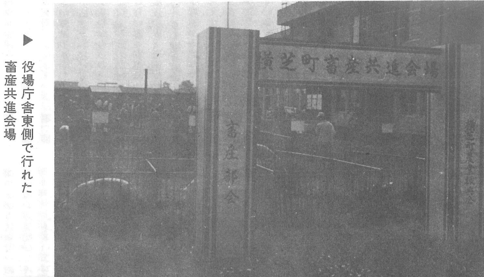
▶ 役場庁舎東側で行れた畜産共進会場