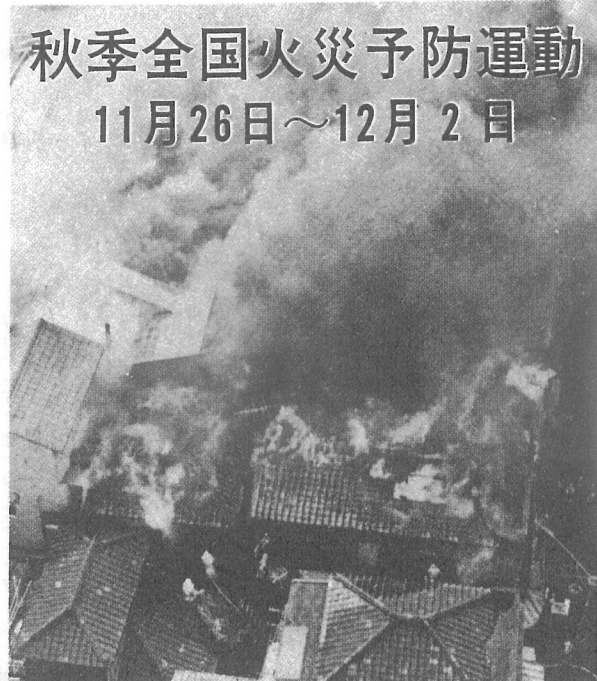
住宅密集地の火災