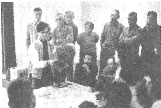
好評だった前回の盆栽教室

皆さんとおなじみになりました公民館の成人学校では、第六回の受講生を次のとおり募集いたしますので、受講を希望される方は、九月二十日から二十七日までの間に中央公民館事務室へお申し込みになって下さい。 今回開設する科目は、やさしい法律、英会話、農業経営、商業経営、盆栽、ペーパー習字、着物の