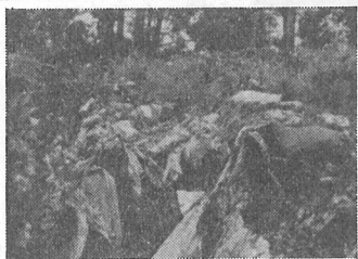
不法投棄はやめよう

町をきれいにする運動の一環として、婦人会、青年団により去る五月二十八日、役場公民館、老人ホーム、給食センター等施設の清掃が実施されました。これは、婦人会、青年団相互の本年度事業計画