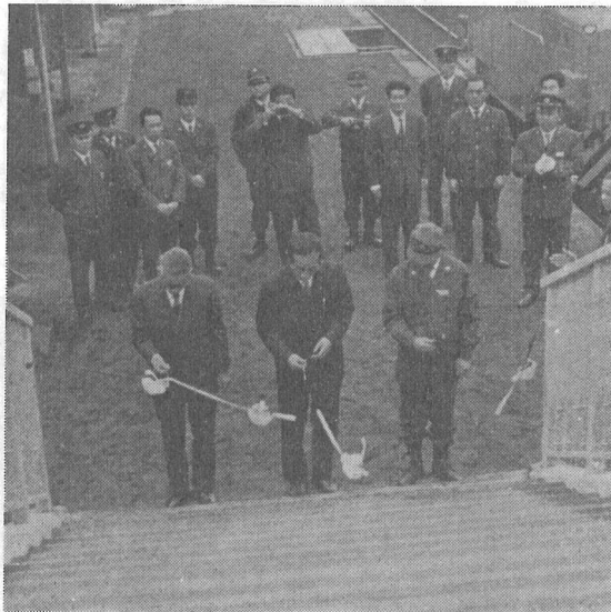
▶ テープを切る(右、銚子保線区長 中央、光町長、左、横芝町長)