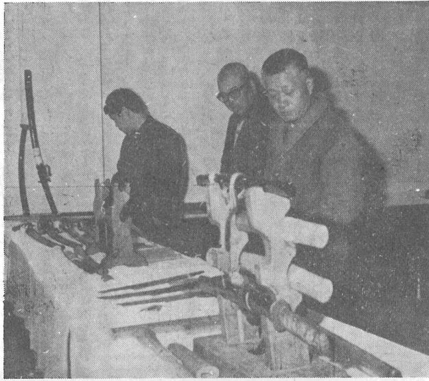
陳列された幕末の名刀

横芝町第一回文化祭は、二秀雄氏)や今から約百万年前十一日から三日間に亘って、町中央公民館で開かれました。会場は、公民館講座等で修得した華道、美術、手芸品でうめつくされていました。展示品の中には切り抜き絵(古川