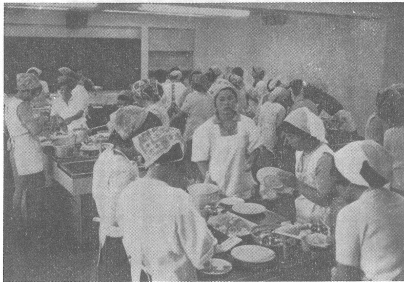
いつでもにぎやかな料理教室