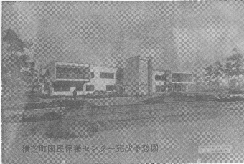
横芝町国民保養センター完成予想図

山武郡横芝町横芝636番地 横芝町役場 電話 04798-2-1111(代) 郵便番号 289-17