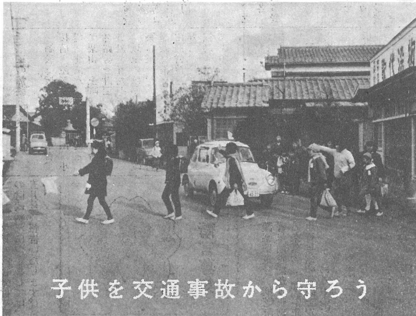
子供を交通事故から守ろう

ます。このように増加の途をたどる交通事故発生にブレーキをかけるため四月六日から十五日の十日間、全国、いっせい春の交通安全運動が実施されます。この運動は人命尊重の見地から交通事故防止の徹底、とくに時期的に子供の入園、入学期に当