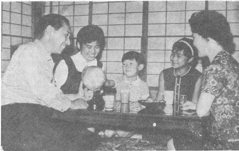
お父さん、ピャフラって何処？ ぼく知っているよ、ここだよ ——夕食後一家だんらんのひととき——

次代をなう健全な青少年を育成するには、よい家庭環境づくりが必要で、最近生活様式の変化等からややもすれば家庭生活本来の姿が失われがちです。そこで三年前から県や町の青少年問題協議会では毎月第三日曜日を「家庭の日」と定めて、家族はもちろん社会全体で明るく健康な家庭をつくるよう広く県民運動としてよびかけています。 この日は、家族みんなが顔をそろえなごやかな団らんを通して、全員の意志の疎通と