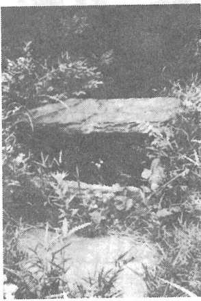
立余の... 木立の... 杉出の... と露余の... をれは... 周囲石... 知

昭和四十四年六月七日付告示、同六月十三日招集の定例会は午前十時開会 ▽議案第一号 横芝町の税条例の一部を改正する条例制定 ▽議案第二号 横芝町国民健康保険税条例の一部を改正する条例制定 ▽議案第三号 横芝町消防団員等公務災害補償条例の一部を改正する条例制定 ▽議案第四号 千葉県旧市町村職員組合資産管理組合規約の一部を改正する規約制定