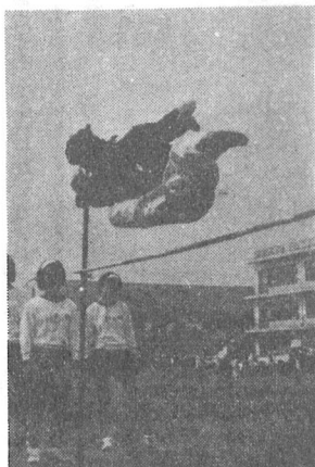
跳んだゾ……見事にとんだ