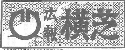
この広報は各家庭にもなくなく配布します 発行・所千葉県山武郡横芝町横芝役場 (電話) 32・249・339

抱負や方針、た設計による町造りに持って行かなくてはならないと思っていいます。 これについては、目下事務局で総合開発計画を策定中であるから、その確定を待つて実施に移していきたい。 何れにしても町政の執行に当っては、公平無私の精神をもって誠心誠意努力し、活気ある繁栄横芝町の現実に献身的な所存である。