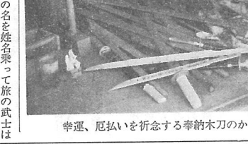
幸運、厄払いを祈念する奉納木刀のかずかず