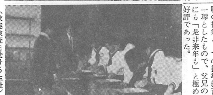
(完成したプール) (技能検査を受ける生徒)