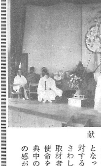
中学校体育館の祭設で