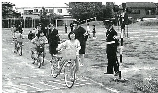
白浜小学校 交通安全教室