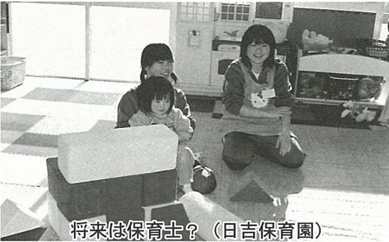
将来は保育士? (日吉保育園)

中学校では、平成12年度から2年生を対象に職業体験を行っています。今年度も、1月17日から19日までの3日間、生徒自らが希望した商店、飲食店、福祉施設などの約50箇所です仕事の体験をしました。受け入れた各事業所のみならず、慣れない環境の中で戸惑う生徒を丁寧に指導し、仕事の大切さや素晴らしさを