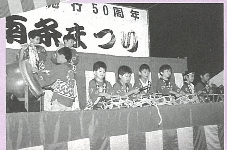
ぼくたちも演奏しました