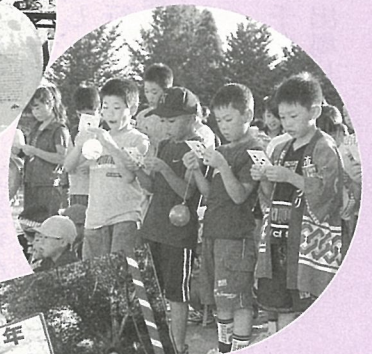
▶わっしょいわっしょい