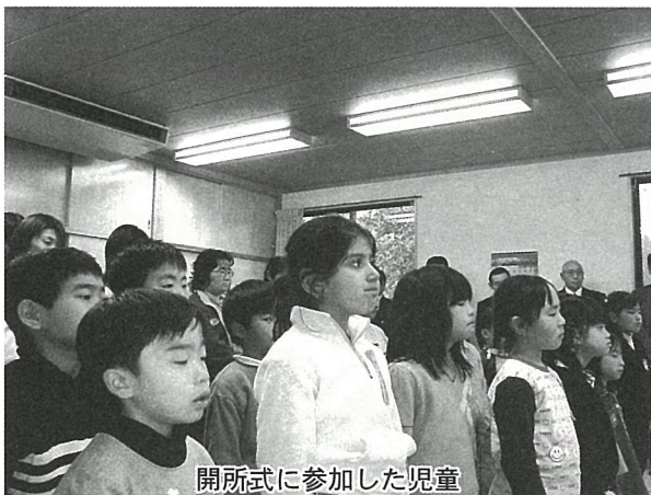
開所式に参加した児童