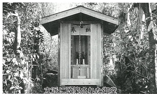
立派に改築された御堂

篠本三区で「目の神様」として古くから信仰されているお薬師様(薬師如来像)の御堂が、昨年12月に篠本三区のみなさんの協力により改築されました。 このお薬師様は木像で、昨年6月に行われた古代ロマン発見教室でこの地域を調査した東総文化財センターの職員によると、平安時代か鎌倉時代に造られた薬師如来像の可能性が有るといふことです。