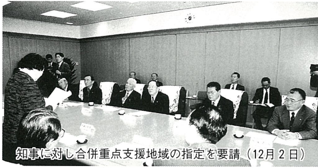
知事に対し合併重点支援地域の指定を要請 (12月2日)

今後、1市2町は合同で法定合併協議会の設置に向けて、協議会の規約、委員構成、予算、スケジュールなどを話し合い、合意後各市町議会の議決により法定合併協議会の設置となります。