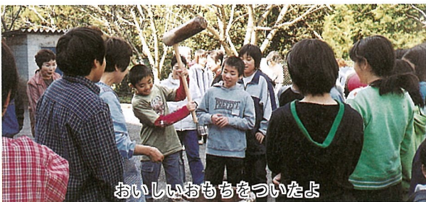
おいしいおもちをついたよ

南条小学校で11月2日、授業参観・バザーに続いてもちつき大会が行われました。もちつきは保護者と児童が協力して行き、児童達はうすときねを使ってのもちつきを存分に楽しんでいました。また、お雑煮やあんこ・きな粉もちなどを保護者と一緒に食べ、つきたてのおもちのおいしさを味わっていました。