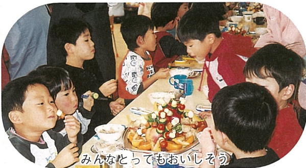
みんなとってもおいしそう

日吉保育園で11月13日、おにぎりパーティーが行われました。準備は年長児13名と保護者が行き、昼食は年少児も一緒に年長児が作った串さしスナックや豚汁を食べました。園児達は自分の手で握ったおにぎりを美味しく口に頬張り、とても素敵なパーティーになりました。