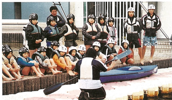
カヌーの漕ぎ方も習いました