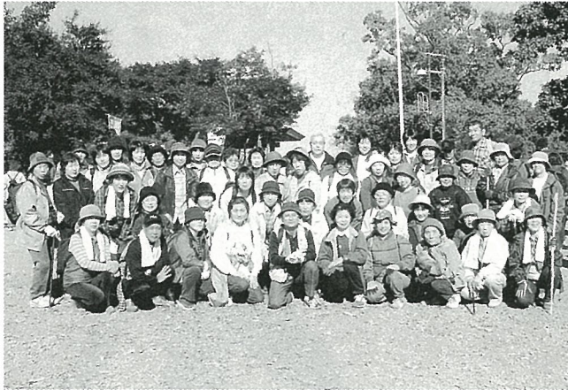
高尾山の頂上で記念撮影

参加者たちは薬王院に至るまでの参道を抜け、頂上めざして登り、びわ滝川の清流に沿って下る約7キロのコースをハイキングし、高尾山の紅葉を楽しみました。