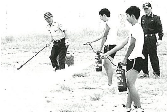
火元めがけて消火器を操作