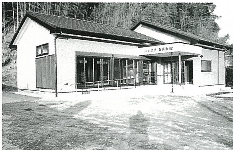
新築した篠本三区区民会館

防止のため防犯灯を33基設置しました。 ▼コミュニティ助成事業（1,076万円）：篠本三区区民会館の新築、桑郷区集落センターの施設改修に補助しました。