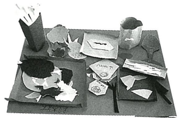
『おいしいごちそう』