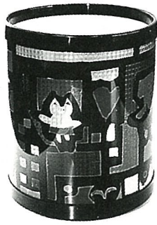
『クリスタルランド』

※細かい作業でしたが、犬の表じょうがうまく出せるようになった。うにがんばりしました。