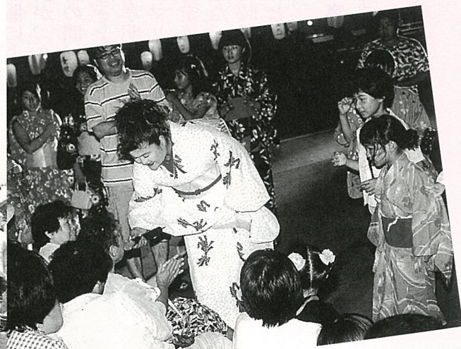
歌謡ショーで盛り上がった前夜祭