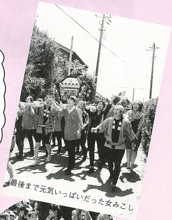
最後まで元気いっぱいだった女みこし