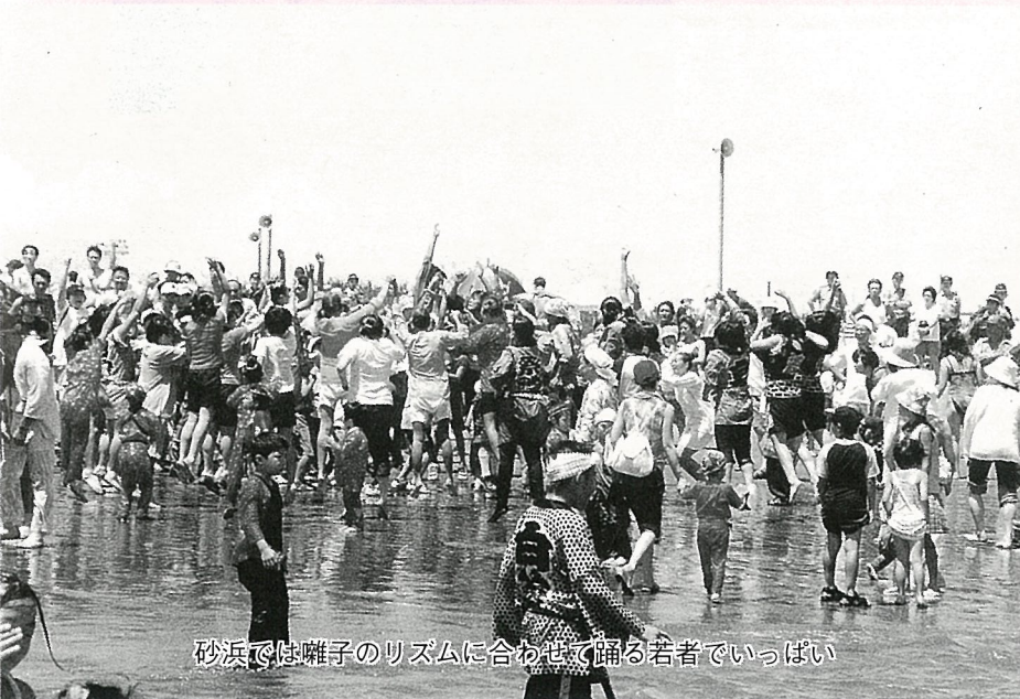
砂浜では囃子のリズムに合わせて踊る若者でいっぱい