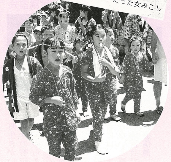
笛も衣装もキマッテル!