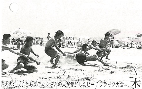
大火から子どもまでたくさんの人が参加したビーチフラッグ大会

木戸浜海水浴場の海開きが7月20日行われました。海の安全祈願祭のあと、宝さがしやビーチフラッグ大会等のイベントも行われ、来場者は思わぬ景品を手に入れた。満喫しました。