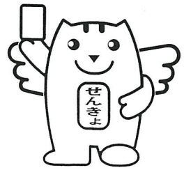
明るい選挙のイメージキャラクター 選挙のめいすいくん