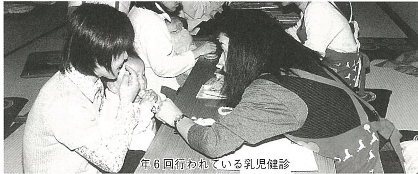
乳児健診 6回行われている

境実現のため早期及び通常保育時間終了後の延長保育、産休明けからの乳児を預かる乳児保育に対し積極的に助成します。 ▼健康づくり事業（979万円）―結核検診、がん検診、基本健康診査、乳児・1歳6ヶ月児・3歳児健診、妊婦健診を行っています。また、今年度から忙しくない方のため、がん健診・基本健康診査は土曜日にも受診日をもうけます。