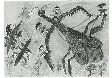
『カマキリとあそんだよ』