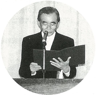
◀1月4日新春パーティーで宣言文を読み上げる向後町長