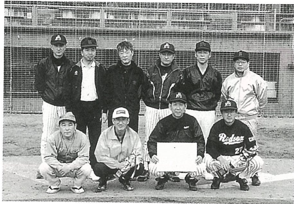
▶見事優勝した 小田部チームの皆さん