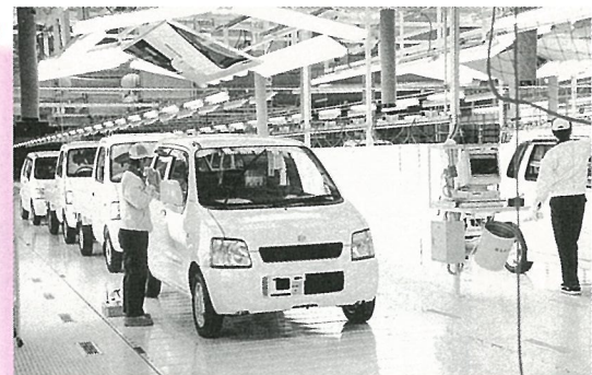
(株)スズキ納整センター 千葉納整センター操業開始

ひかり工業団地に、軽自動車最大手スズキ(株)のスズキ千葉納整センターが12月1日から操業開始。