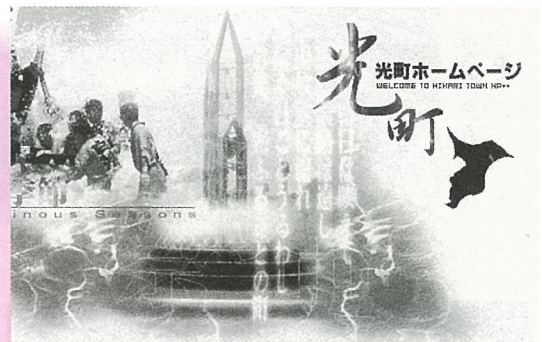
光町ホームページ開設