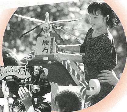
▲まつりの主役はわたしよ!