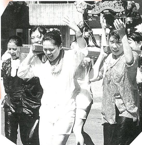
▲まつり気分は最高潮