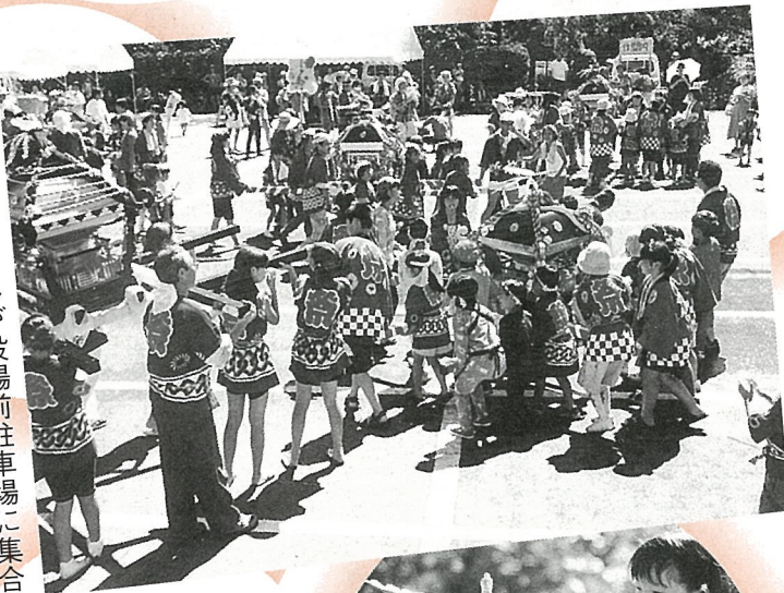
各集落のみこしが役場前駐車場に集合