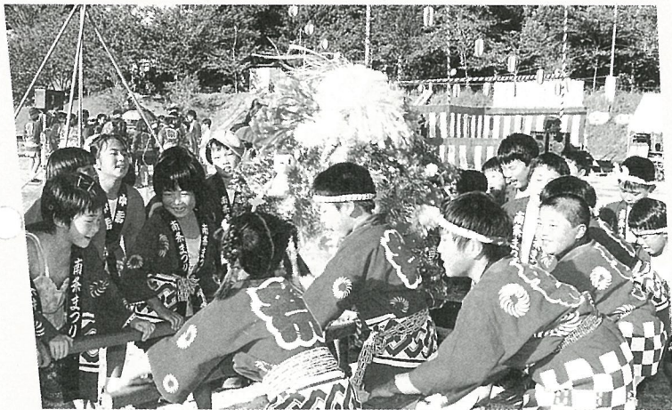
「ワッショイ、ワッショイ」 手作りみこしが大きく上下にゆれます。