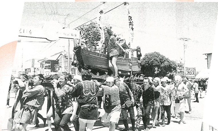
▲重い船みこしは若い力で担ぎます。