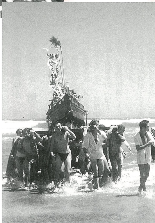
▶今年の波はいつもより荒く迫力満点