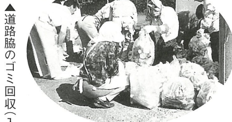
回収したゴミの山(台地区)