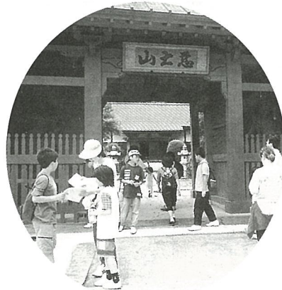
観察ゾーンとなった虫生の広済寺では、問題の答えを探すのに一生懸命(ウォークラリー)