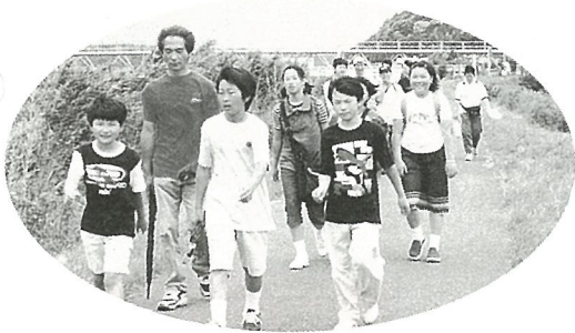
栗山川堤防を元気に歩きます(健康ウォーク)