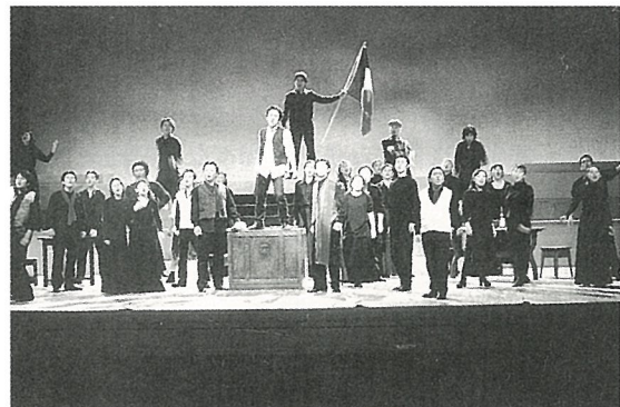
ミュージカル「レ・ミゼラブル」をぜひご鑑賞ください

日時 5月14日(日) 午後1時 会場 町民会館大ホール 会費 大人500円 (入場券は町民会館でお求めください。) 内容 ○生涯学習パネルディスカッション 『うるおいとふれ合いのあるまちをめざして』 講師 齋藤哲瑯先生 パネリスト 住民代表5名 ○芸術文化鑑賞 ミュージカル 『レ・ミゼラブル』 問合せ 生涯学習課 社会教育係 ☎⑧41358