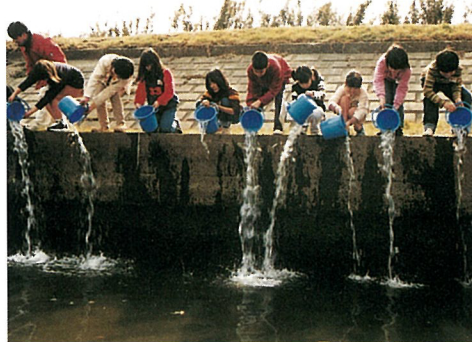
▲「元気でね」と声 をかけながら放流 する児童たち

3月13日、光町と横芝町の小学 生が、12万尾のサケの稚魚放流を 行い、4年後の回帰を祈りました。 この事業は、昭和51年度から平 成10年度まで水産資源や環境保全 として千葉県が実施してきました が、今年度からは「サケが帰る きれいな川(栗山川)」を 推進するため、栗山川漁業 協同組合の協力を得て、光 町と横芝町の両町でサケの 稚魚放流と親魚捕獲をして いくことになりました。 この日、放流を行った東 陽小3年生29人は、 「さようなら、大 きくなって帰っ てきてね。」と、水 面に元気に泳ぐ稚 魚を見送りました。