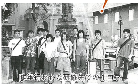
昨年行われた研修先での1コマ